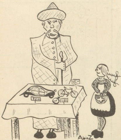
Mei mei Japanerli, jetzt tüend dänn Euseri Rekordpris um es Prozant sinke, dänn chasch Dis Lädeli bschlüsse!