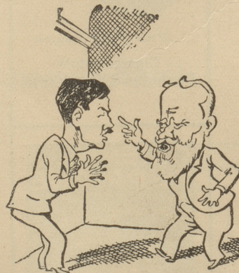
Bernhard Shaw: «Warum ich für Italien bin und nicht für Abessinien? — sehr einfach; weil man meine Theaterstücke in Italien spielt und in Abessinien nicht!» Mucha, Warschau