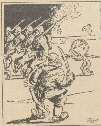
«Was!? Du willst den Dienst verweigern!» Washington Post