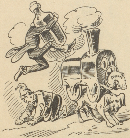
Wenn der Bund mit dem Schnaps über's Volk wegspringt und die Bahn auf dem Hund unser Geld verschlingt —