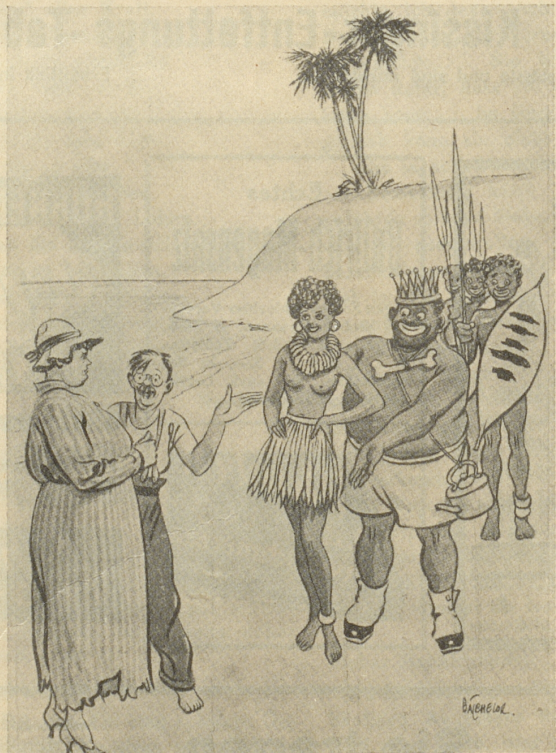
«Du siehst, meine Liebe, der Häuptling wünscht Geschenke auszutauschen!» London opinion

Wegen dem verteuerten Benzin Geb' ich billig meinen Benz-h-in.