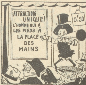
Hier sehen Sie den Mann, der seine Füsse dort hat ...

Bald hatte ich in Erfahrung gebracht, dass der Oheim ein angesehener Kaufmann wäre, der im Westen der Stadt ein grosses Haus führte. Ich stellte mich auf vornehme Art vor, indem ich einen Hotelboy mit einem Schreiben zum Onkel schickte. Am nächsten Tag erhielt ich Antwort, dass man von meinem