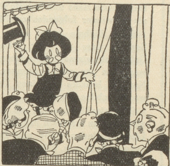
... wo andere Menschen die Hände haben ...