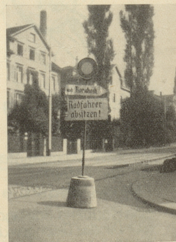
Das isch aber kei bequems Bänkli!