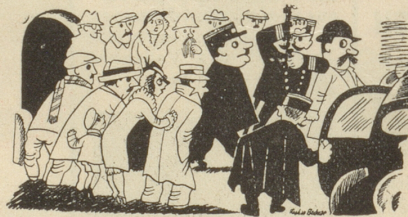
«Man könnte meinen, Ihr habt noch nie gesehen, wie man einen Abgeordneten abführt!»