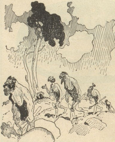
«Ich bin begeistert! Denn dieser Krieg sichert der Menschheit den ewigen Frieden!» Judge, New-York