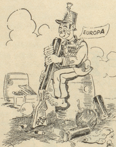
«Jetzt nimmt es mich doch wunder, ob es geladen ist!» The Journal, Dallas

4 Worte nur: TRINKT LOSTORFER EXTRA TAFELWASSER