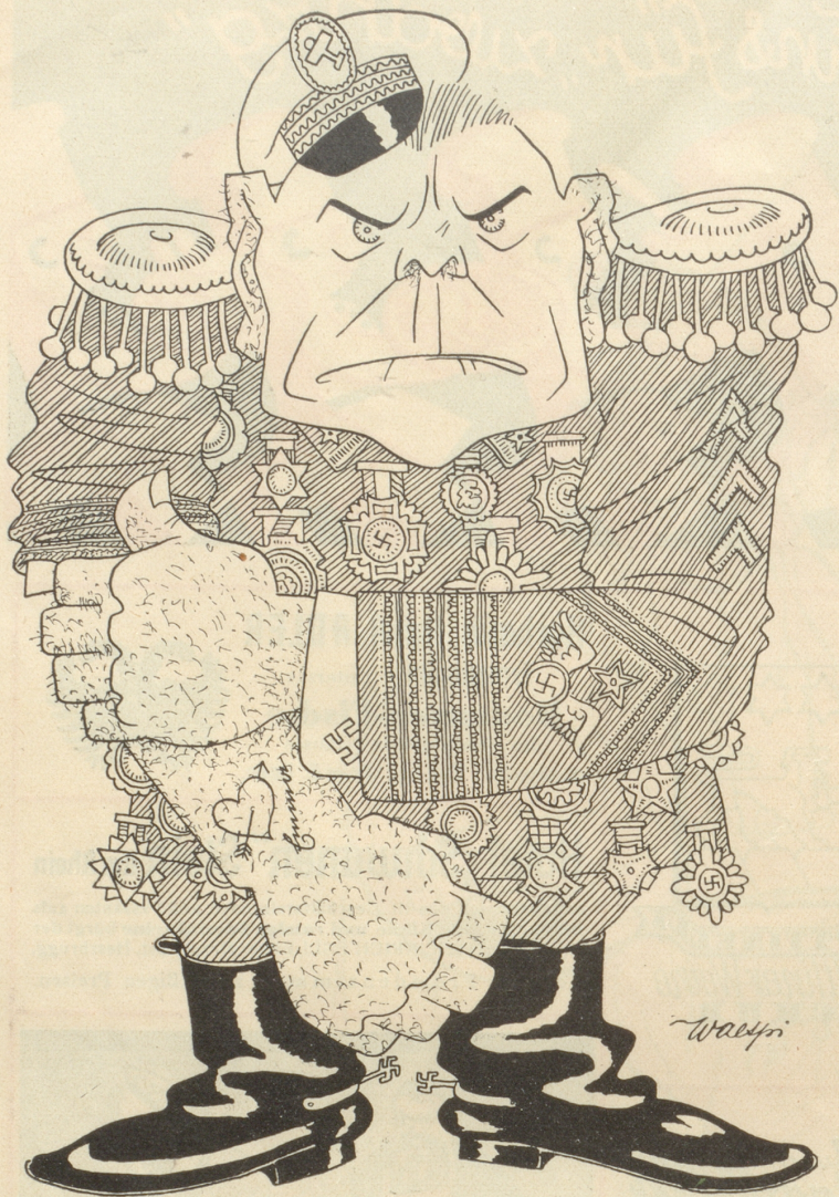
Göring will dem Hirnschalendrekländchen mit dem Biceps die überlegene Intelligenz beweisen.