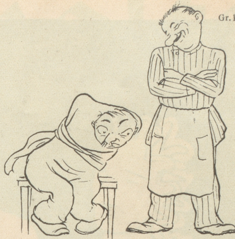
Hilft das nicht, so