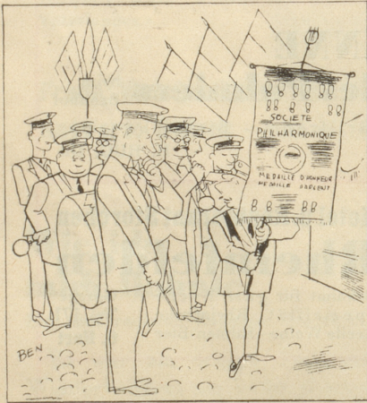
Zum Bündnis Frankreich-Russland

«Und nun spielen wir die Marseillaise nach der Melodie 'Die Internationale'!» Le Rire, Paris