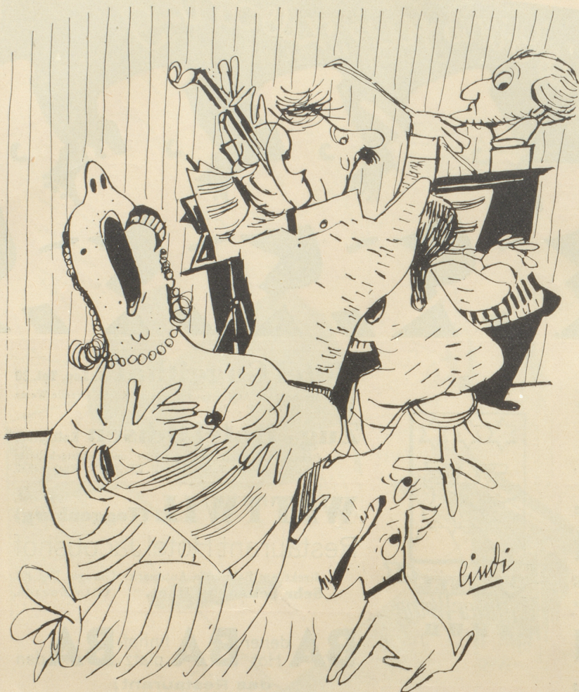
Wo man singt....