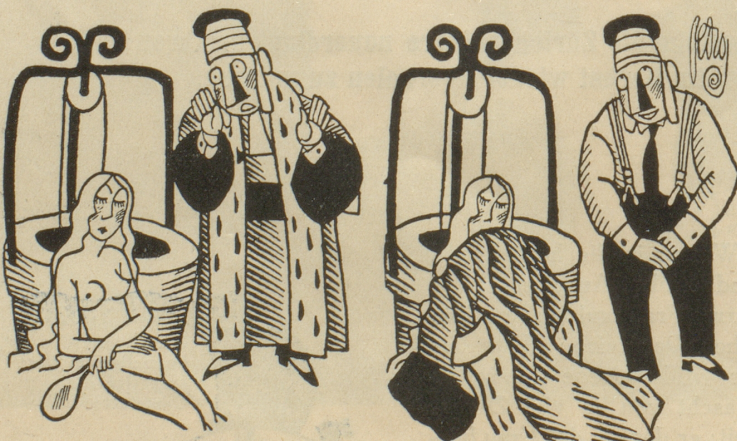
Die nackte Wahrheit — und der mildtätige Richter.