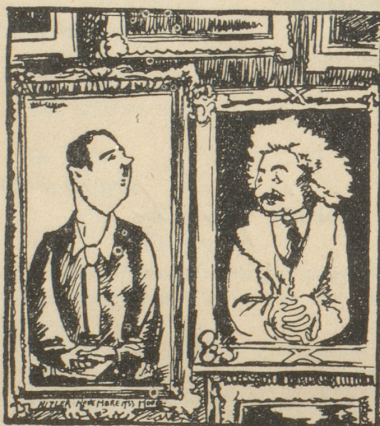
Auf der Ausstellung der Royal-Society in London hängen Hitler und Einstein freundlich nebeneinander. (Le journaux)