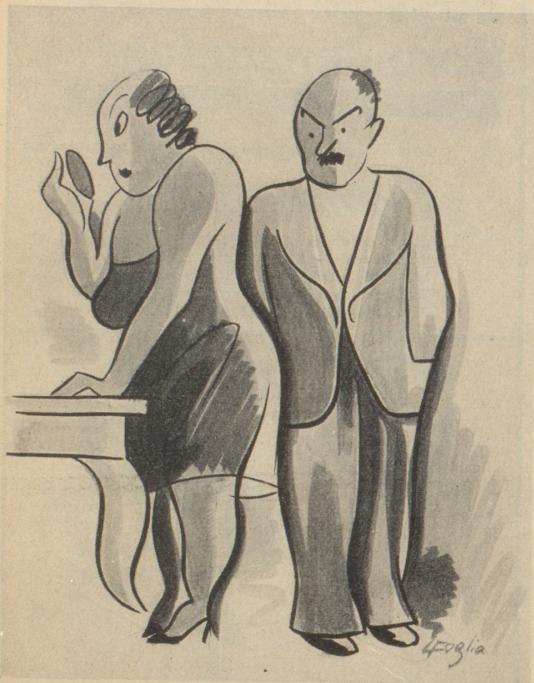
Nach der Meinung eines berühmten englischen Arztes werden die Frauen immer schöner.