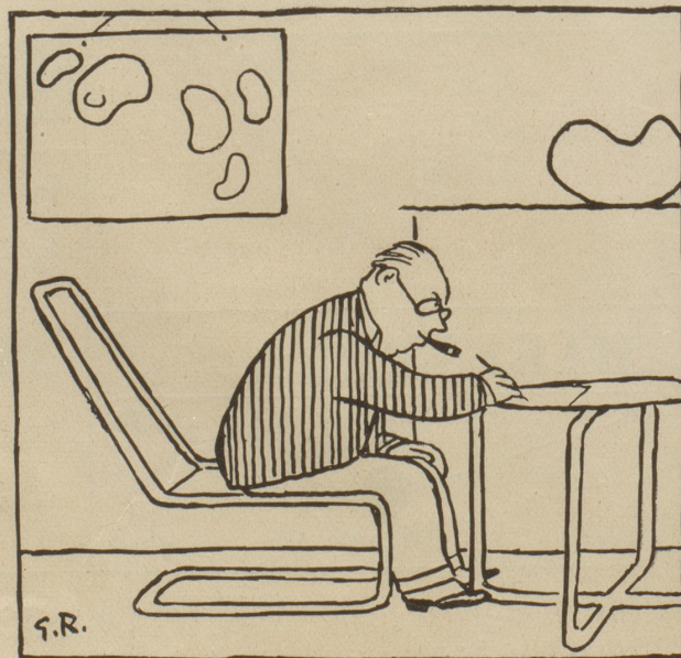
Nein, ein surrealistisches Gemälde!