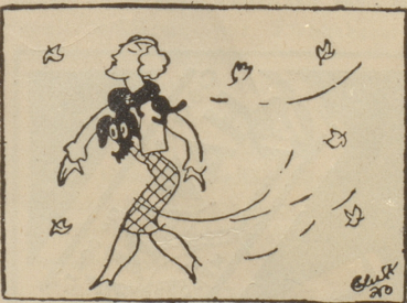
La Libertad, Madrid