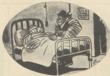
«Sie sind ein aparter Fall!» Das erste Stromlinienopfer! Judge