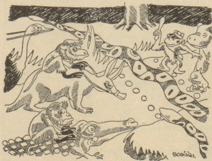
Verkehrsregelung im Tierreich

Wenige Minuten vor der Abfahrt kommen wir am Bahnhof an. Warum also sich aufregen, alles hat ja geklappt! «N'est-ce pas, on arrive toujours à s'arranger!» P. M.