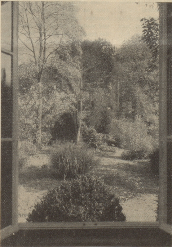
Blick von einem Ostzimmer in den Park der Liegenschaft

Einziges am See gelegenes Café und Restaurant. Wein, Bier, Café etc. in bester Qualität. Treffpunkt aller Fremden und Sportsleute. Ed. Langer.