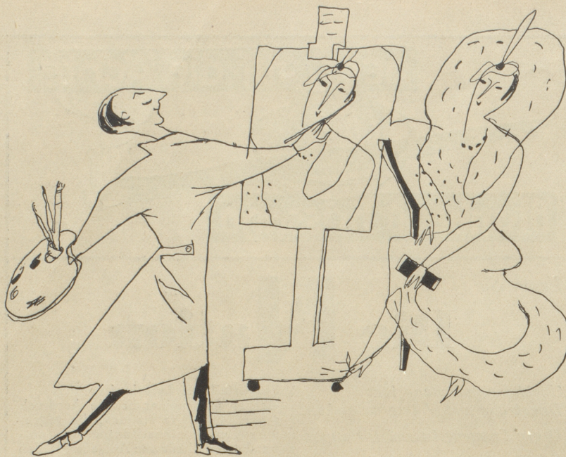
Der letzte Strich...