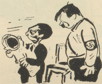
„Mein lieber Göbbels ... ich glaube bald, das Kind ist doch von Dir!“