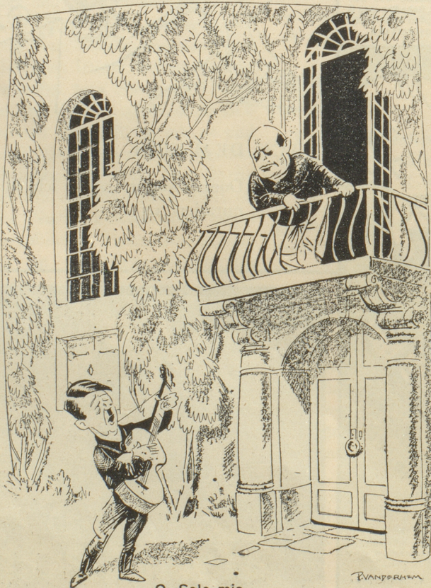
O, Sole mio.....