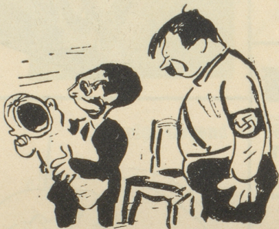
„Mein lieber Göbbels ... ich glaube bald, das Kind ist doch von Dir!“