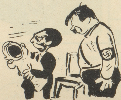
„Mein lieber Göbbels ... ich glaube bald, das Kind ist doch von Dir!“