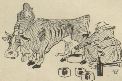
«Seit drei Jahren wird das Vieh nur noch mit Verordnungen gefüttert — und jetzt gibt es richtig Tinte statt Milch!»