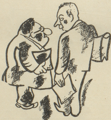
«Wo ist da das Bureau für Wirtschafts- planung?»