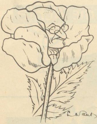
GANDHI . INDIA