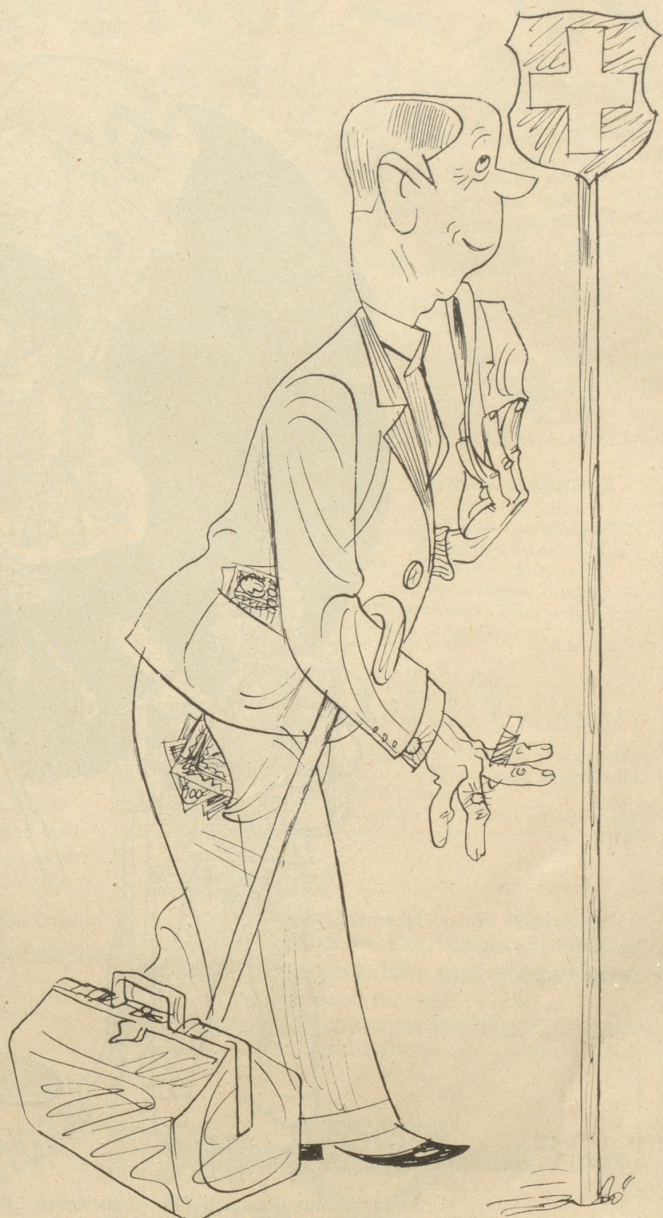
Diese Seite ist der Schweiz zuzuwenden