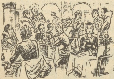
DIE DAME mit dem horizontalen Hütchen. Punch

ter mit einem alten Lehrer aus ihrer Schulzeit ein Glas Champagner getrunken hatte, dito mit dem Chef ihres Mannes, mit dem Freund ihres Bruders sogar eine