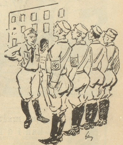
Mädchen in Uniform

„Du Schatz — wie viel Bomben kann eigentlich ein Zeppelin tragen?“