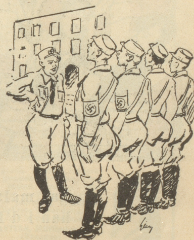
Mädchen in Uniform

„Du Schatz — wie viel Bomben kann eigentlich ein Zeppelin tragen?“