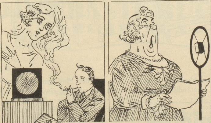
Die Künstlerin vor dem Hörer vor dem Mikrophon