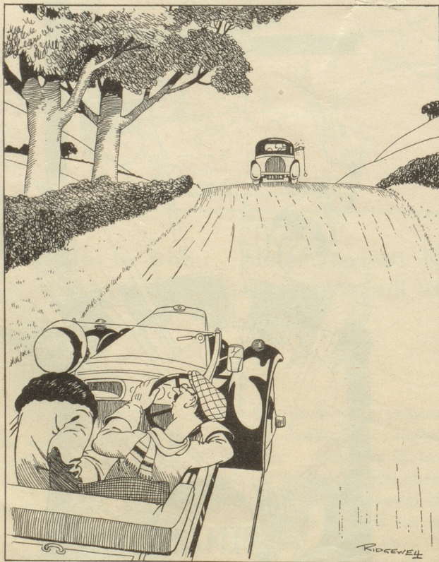
„Du, ich glaub, der da vorn hat ein Rädchen zu viel!“