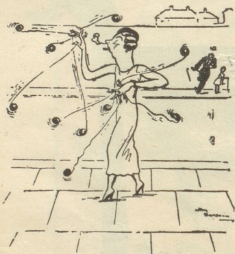
Unser aller Vorbild (Punch)