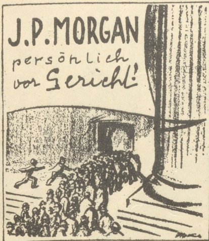
Die größte Sensation seit Barnum! (Saint Louis Post Dispatch)