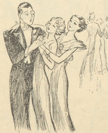
Der Tanz zu dreien ist erfunden ..

Im Nationalrat wurde der Antrag gestellt, als Repressalie für das Verbot einer grossen Zahl schweizerischer Zeitungen in Deutschland, die Nazizeitungen für die Schweiz zu ver-