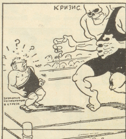
Die Krise und der Volkswirtschaftler (Isvestia) Moskau