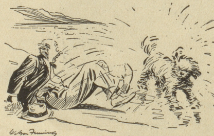
ist etwas Wahres!