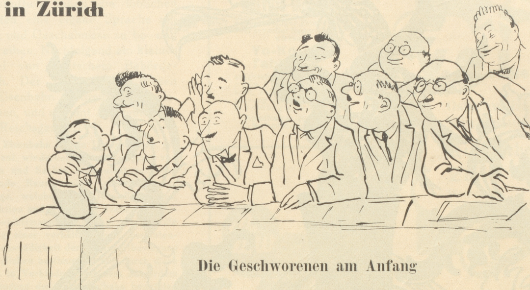
Die Geschworenen am Anfang