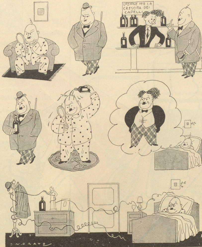
Drama ohne Worte oder: Der Traum und die Wirklichkeit.