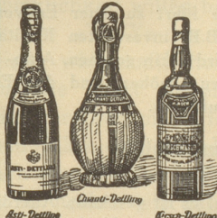
Asti-Dettling Chianti-Dettling Krone-Dettling