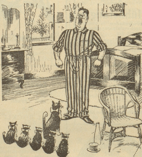
Die Katze des Feldwebels hat Junge bekommen.

„Liebling, ich fürchte, Vater wird schimpfen, wenn wir das Licht ausmachen!“ Judge