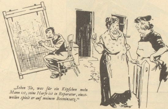
„Sehen Sie, was für ein Köpfchen mein Mann ist, seine Harfe ist in Reparatur, einstweilen spielt er auf meinem Bettensatz.“

«Die roten Lippen, die küssten so wild, so stürmisch, so sinneverwirrend;