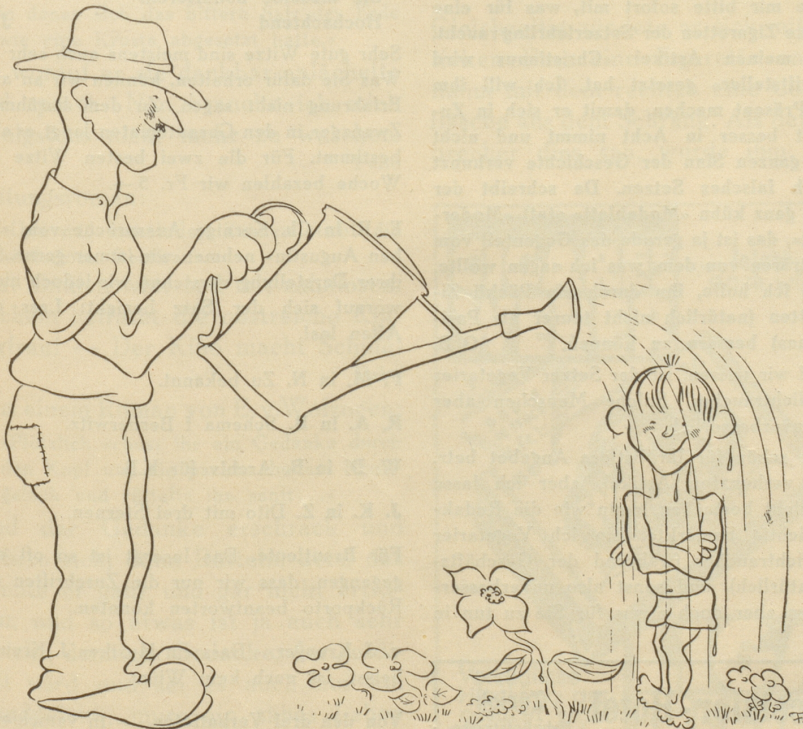
Der Gärtner pflegt sein Pflänzchen

«Was wäre das für ein Mittel?» «Legen Sie ein Geständnis ab!»