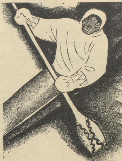
2. Der Eskimo trägt keine SUN , weil er sie nicht kennt.