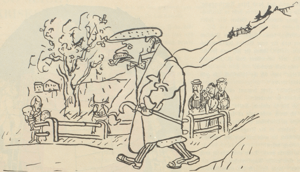
Der erste Kurgast.