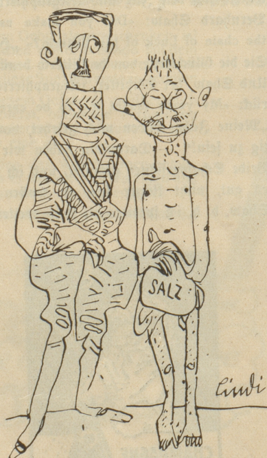
Gandhi und der Vizekönig von Indien

Maschinenschrift. Original italienisch. Die Kette darf in keinem Lande aufgehakt werden. Sie hat am 3. März 1930 begonnen. Bisher kufierte sie in Italien, Frankreich, England, Deutschland, Schweden, Finnland, Norwegen, Amerika, Schweiz. Sie soll in sieben Jahren neun Mal