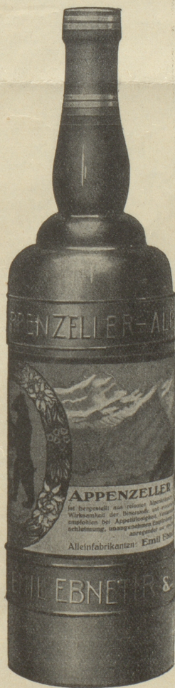
Alleinfabrikant: Emil Ebnetter & Co., Appenzell

Verlangen Sie in jedem Restaurant Appenzeller Alpenbitter!