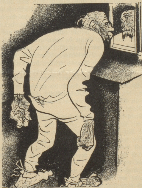
3. Der Hintermoser trägt keine SUN , weil ihm seine baumwollene Unterhose besser gefällt.