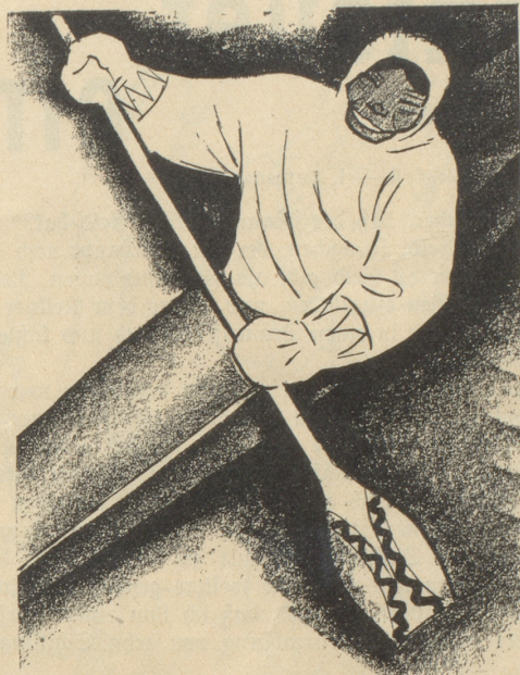
2. Der Eskimo trägt keine SUN , weil er sie nicht kennt.