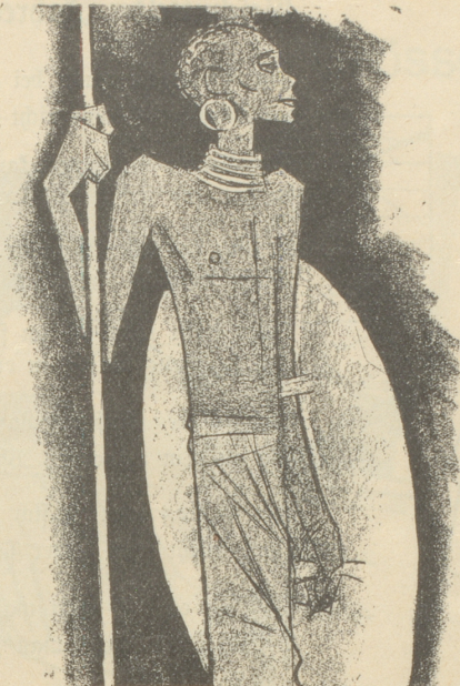
1. Der Zulu trägt keine SUN , weil er sie nicht braucht.