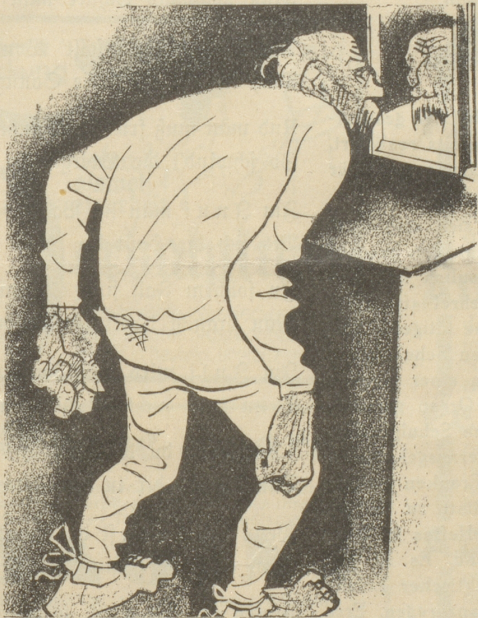
3. Der Hintermoser trägt keine SUN , weil ihm seine baumwollene Unterhose besser gefällt.