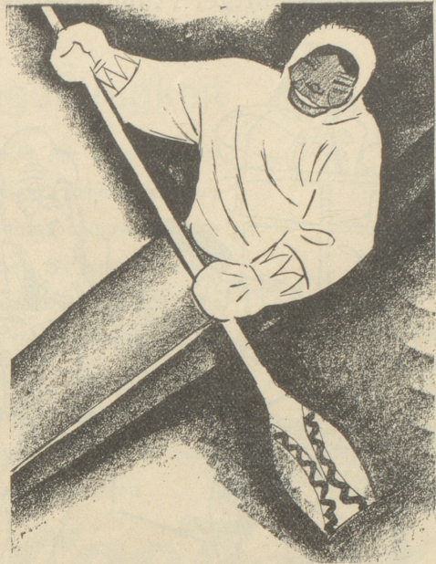
2. Der Eskimo trägt keine SUN , weil er sie nicht kennt.