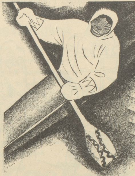
2. Der Eskimo trägt keine SUN , weil er sie nicht kennt.