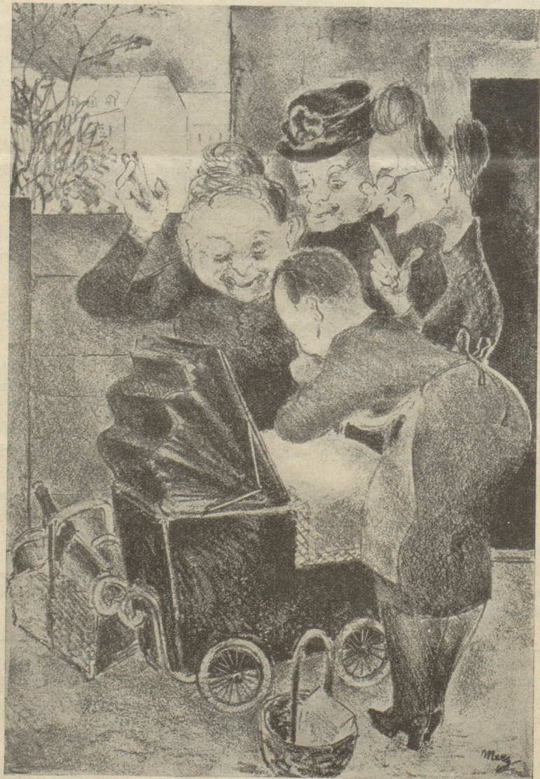
„Wowoli ischteli 's Bubeli... wowoli?“